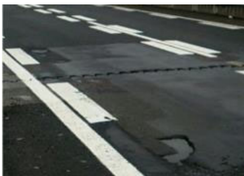
舗装の損傷状態イメージ