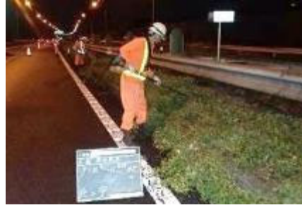
雑草の草刈りイメージ