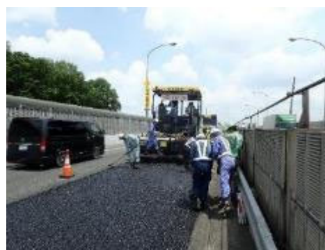
舗装工事イメージ