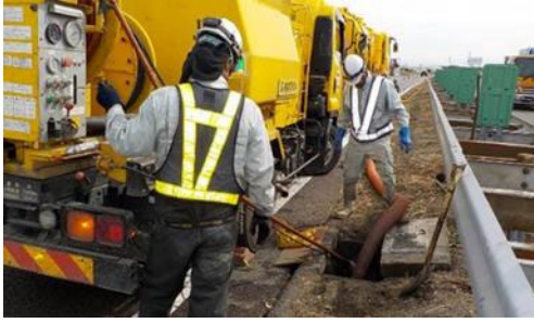
集水ますの清掃イメージ